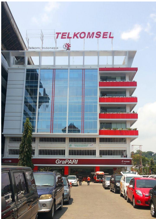
Gambar 2.3 Kantor PT TELKOMSEL REGIONAL JAWA TENGAH & DIY