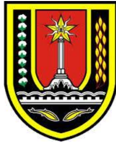
Gambar2.1 Logo Dinas Kelautan dan Perikanan Kota Semarang.