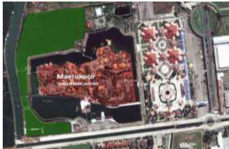
Gambar 1.2 Lokasi Taman Puri Maerakaca dilihat dari atas