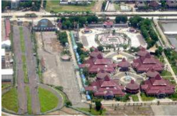
Gambar 1.1 Lokasi PT. PRPP Jawa Tengah dilihat dari atas