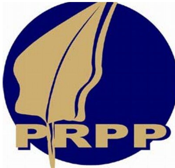
GAMBAR 1.3 LOGO PT PRPP JAWA TENGAH