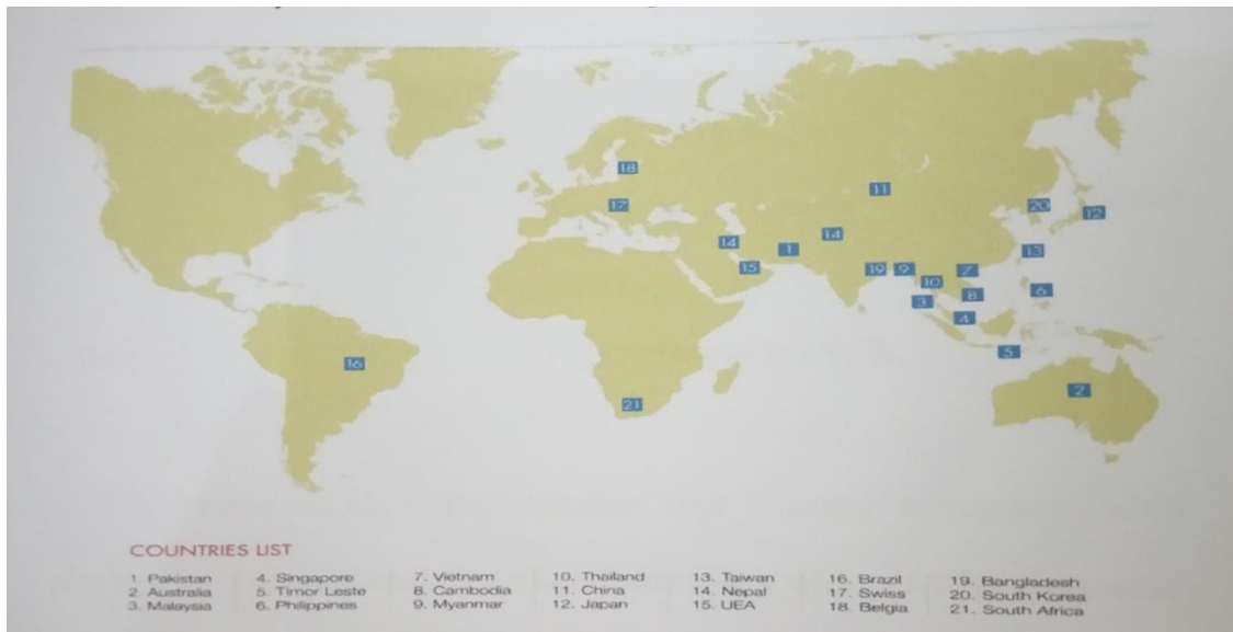
Gambar 2.1 Peta Pemasaran Pelumas di luar negeri

PT Pertamina Lubricants selalu berpegang teguh pada konsistensi mutu dan quality control yang sangat ketat dan mendapatkan ISO 9001 untuk Manajemen Mutu, ISO 14001 Manajemen Lingkungan, ISO 17025 Laboratorium Quality dan memiliki jaringan layanan distribusi yang tersedia di seluruh wilayah Indonesia dan luar negeri.