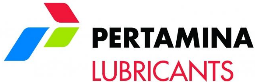
Gambar 2.4 Logo Perusahaan PT Pertamina Lubricants