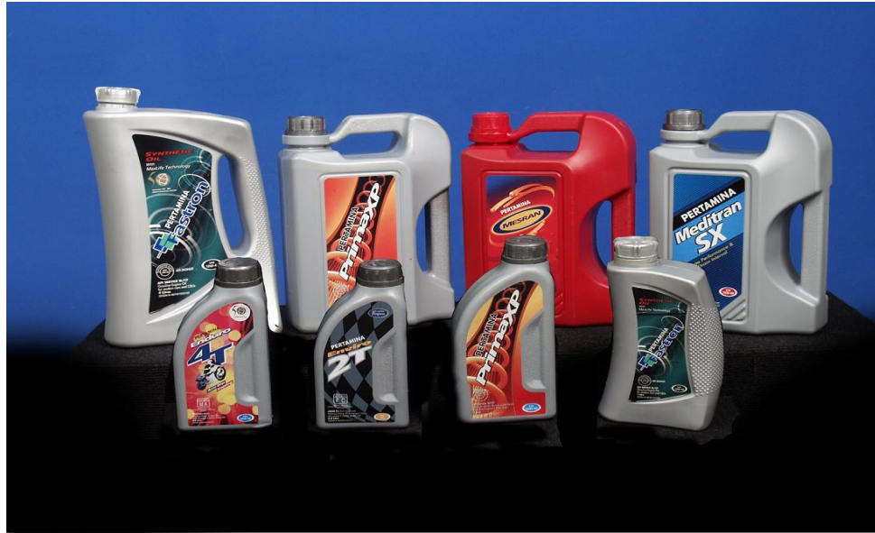
Gambar 2.3 Produk-Produk Pelumas Pertamina

Jenis produksi pelumas Pertamina adalah sebagai berikut :