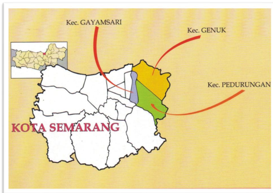
Gambar 2.2. Peta Wilayah Kerja Kantor Pelayanan Pajak Pratama Semarang Gayamsari (tanpa skala)