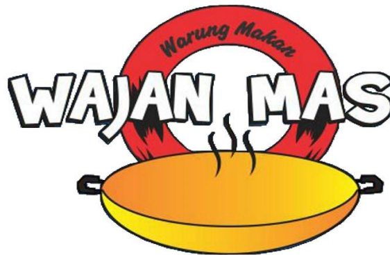
Gambar 2. 1 Logo Rumah Makan Wajan Mas Kudus

Setiap logo tentu memiliki makna filosofis. Adapun filosofi dari logo di atas adalah: