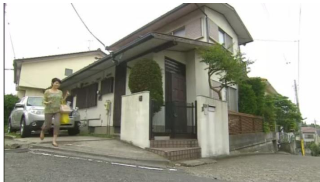
Gambar 3.9. Rumah dan mobil keluarga Nakata

Selain kutipan diatas, latar sosial yang menunjukkan keluarga Nakata termasuk golongan menengah keatas dapat dilihat dari kehidupan mereka dan rumah yang mereka tempati. Nakata memiliki rumah 2 lantai, selain itu mereka juga memiliki mobil.