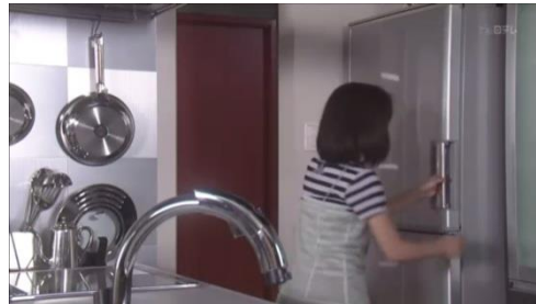
Gambar 3.8 kulkas

Pada gambar diatas terdapat mobil keluarga Nakata, laptop yang digunakan Makiko saat ia berkeja, dan kulkas yang ada di apartemen Naoki. Barang-barang itu merupakan teknologi dizaman modern.