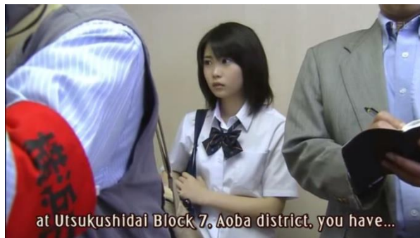
Gambar 3.3. Aoba District

Latar tempat distrik Aoba-ku merupakan salah satu tempat yang ada dikota Yokohama, Jepang. Aoba-ku merupakan tempat Makiko mendapat penghargaan dan daerah apartement Yoshikawa.