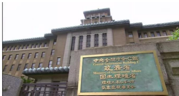
Gambar 3.4. kantor Makiko

Pada drama Seigi no Mikata Kantor merupakan latar yang banyak ditampilkan. Kantor yang sering ditampilkan dalam drama Seigi no Mikata adalah kantor tempat Makiko bekerja. Di kantor itu juga, pertama kali Makiko bertemu dengan Makiko.