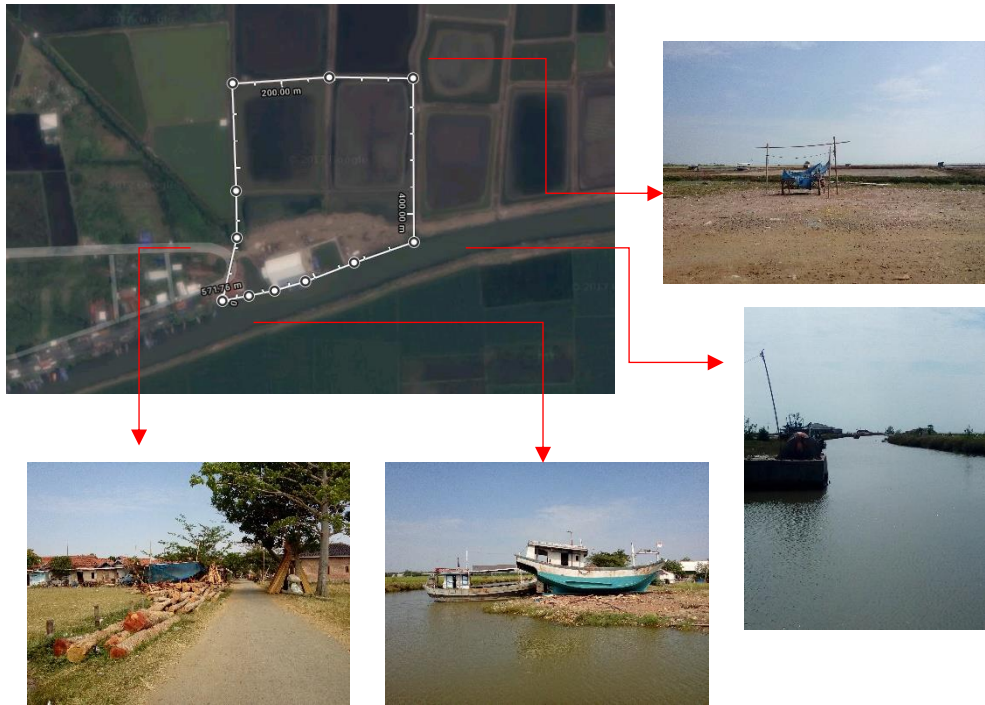
Gambar 5.1 : Kondisi Sekitar Tapak