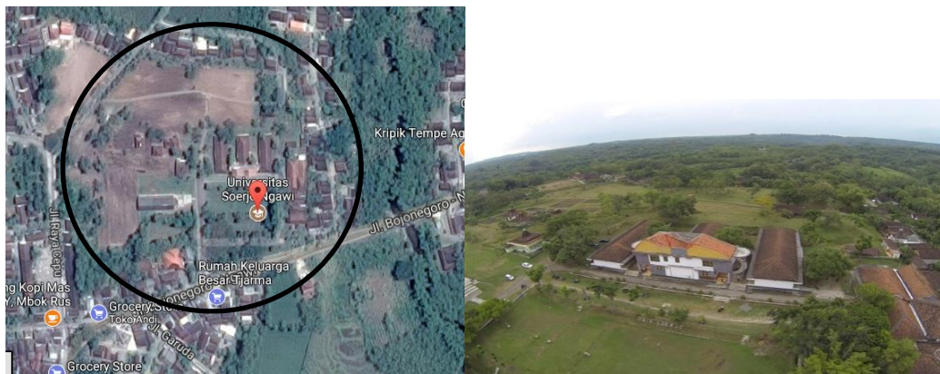
Gambar 5.1 Lokasi Tapak Unsoer