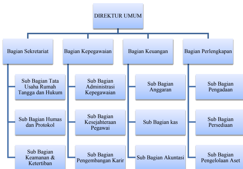
Gambar 2.2 Struktur Organisasi Direktur Umum