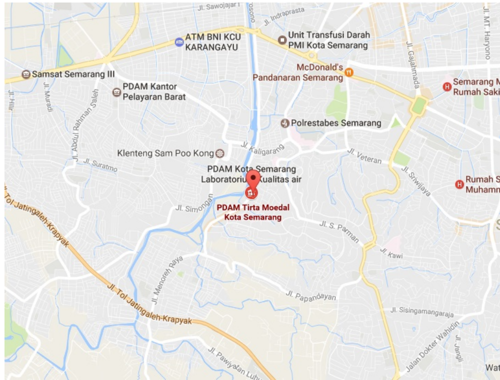
Gambar 2.3 Denah Lokasi PDAM Tirta Moedal Kota Semarang