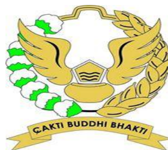
Gambar 2.2. Logo Direktorat Jenderal Pajak