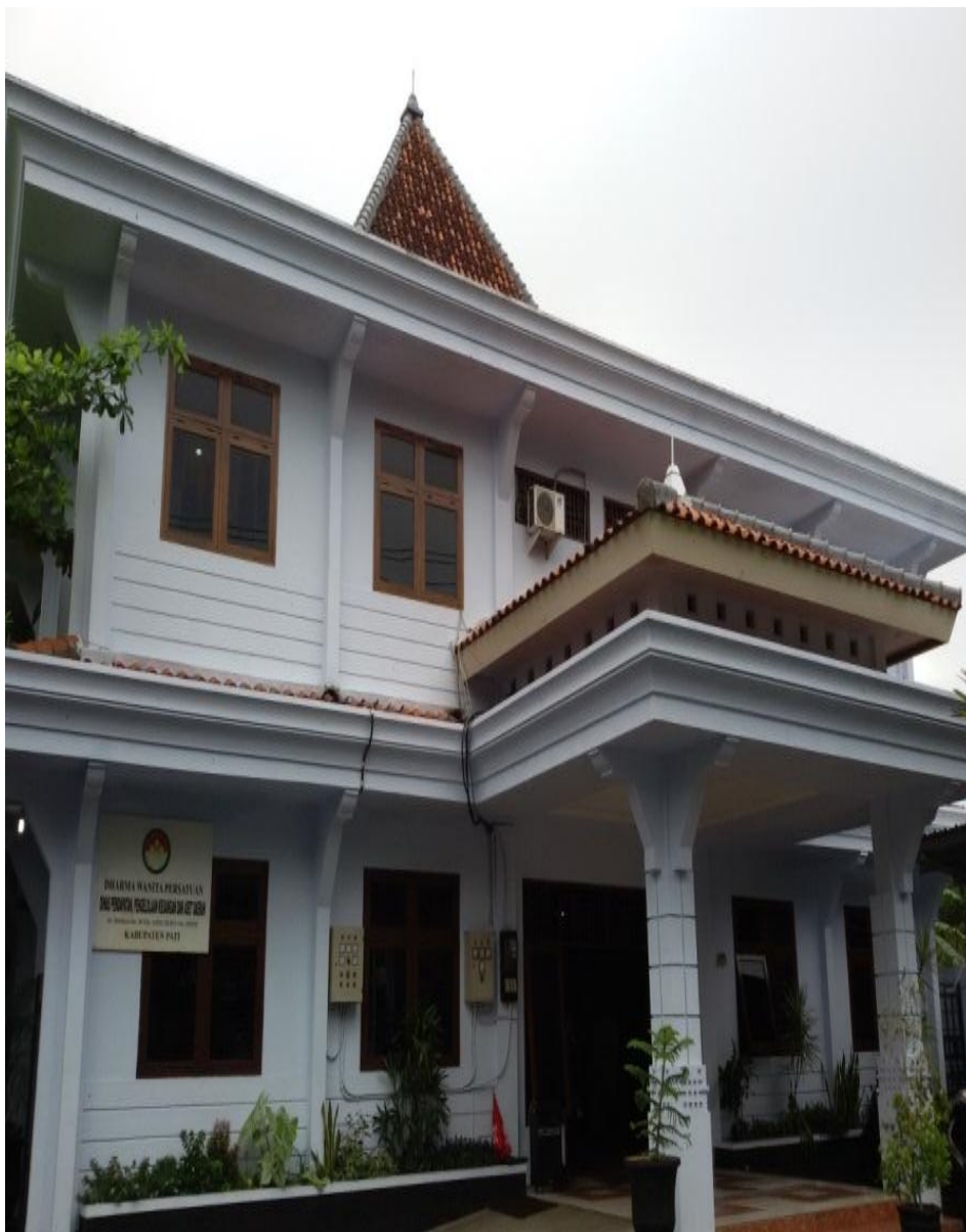
Gambar 2.1 Kantor BPKAD Kabupaten Pati

aset daerah kepada perangkat daerah di Lingkungan Pemerintahan Daerah secara berdaya guna dan berhasil guna juga melaksanakan penataan inventarisasi aset daerah sebagai bentuk kekayaan daerah.