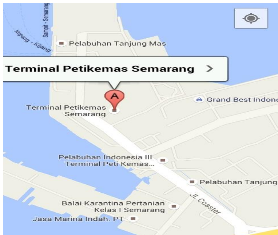
Gambar 1.2 Peta Terminal Petikemas Semarang

Letak Geografis Pelabuhan Tanjung Emas Semarang, terletak di pantai Utara Jawa Tengah tepatnya pada garis 6^{\circ} 56' - 7^{\circ} 10' Lintang Selatan dan 110^{\circ} 25' Bujur Timur. Alamat Perusahaan Terminal Petikemas Semarang adalah Jalan Coaster No.10 A Pelabuhan Tanjung Emas Semarang.