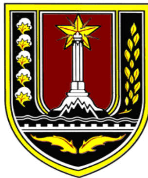
Gambar 2.1 Lambang BAPENDA kota Semarang