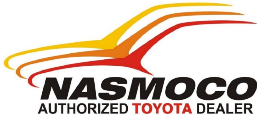
Gambar 2.1 Logo Perusahaan Nasmoco