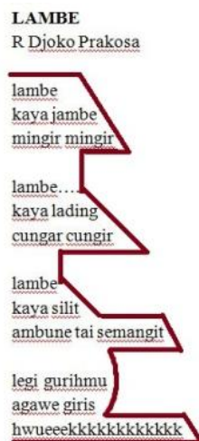
Gambar 1 Gambar Tata Muka Geguritan 'Lambe'

Tata muka dimanfaatkan RDP untuk merepresentasikan isi geguritan dan menunjukkan estetika ruang. Tata muka mbeling yang digunakan RDP dalam geguritan -nya dapat dikelompokkan menjadi tiga kelompok, yaitu tata muka geguritan bertema seks, tata muka geguritan bertema cinta, dan tata muka geguritan bertema sindiran. Geguritan bertema seks direpresentasikan RDP dalam bentuk tata muka setengah badan kumbang, tiga buah segitiga lancip yang saling berkesinambungan, payudara, pistol, lingga, segitiga lancip, segitiga siku-siku, senapan, serta separuh organ reproduksi wanita. Tata muka geguritan bertema cinta direpresentasikan RDP dalam bentuk setengah setang kendaraan bermotor. Tata muka geguritan bertema sindiran direpresentasikan RDP dalam bentuk setengah anak panah yang tajam dan separuh bangunan dengan tiga atap.