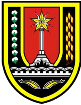
Gambar 2.1 Logo Pemkot Semarang