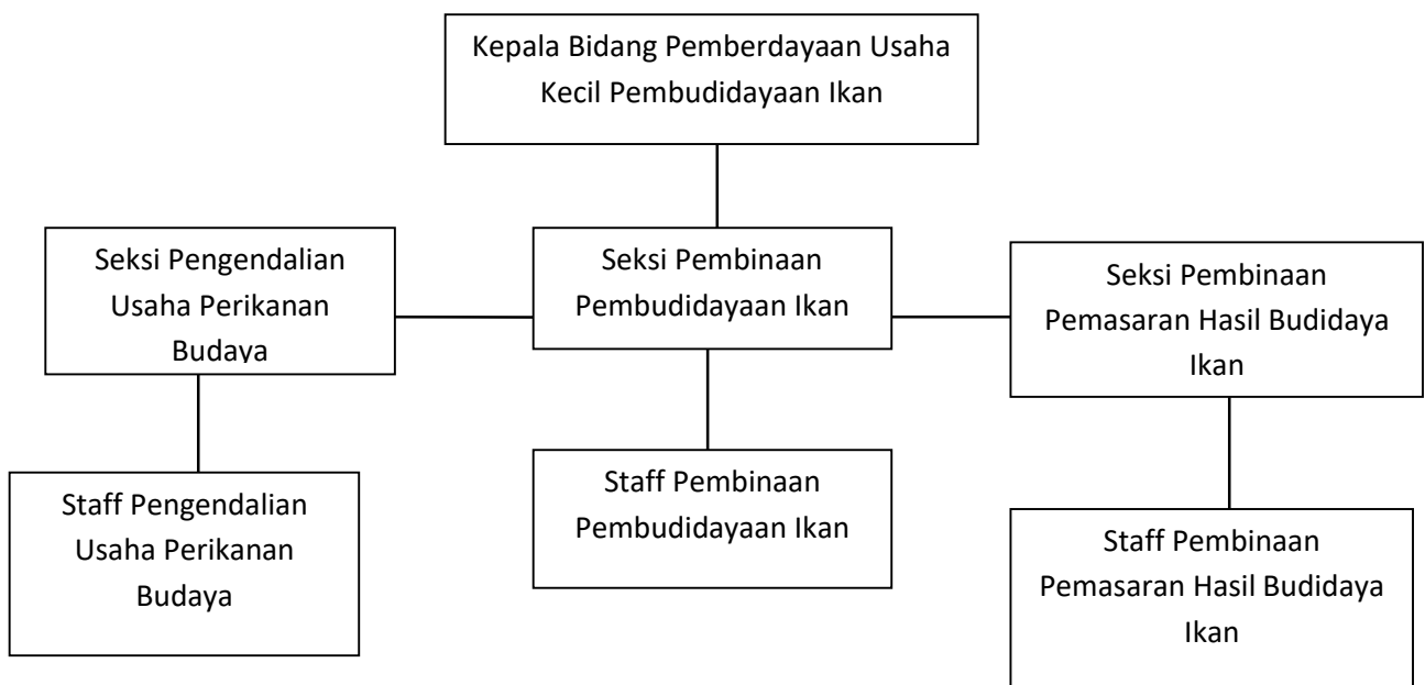
Bagan 2.4 Struktur Organisasi Bidang Pemberdayaan Usaha Kecil Pembudidayaan Ikan