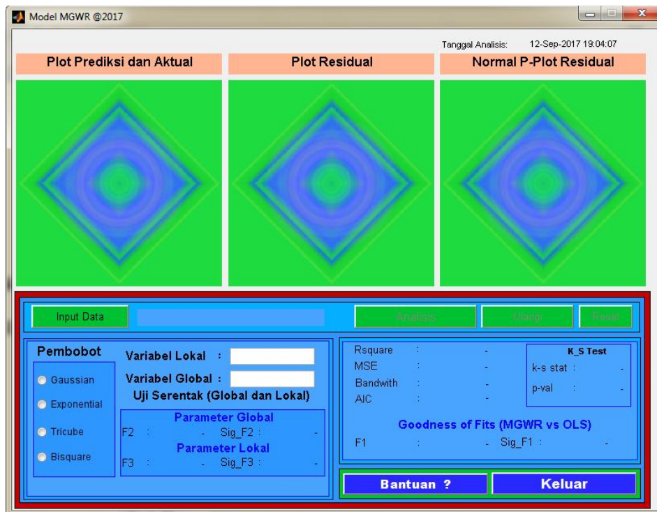
Gambar 1. GUI MGWR

Gambar 1 menunjukkan tampilan desain antar muka GUI metode MGWR yang disusun menggunakan software MATLAB.