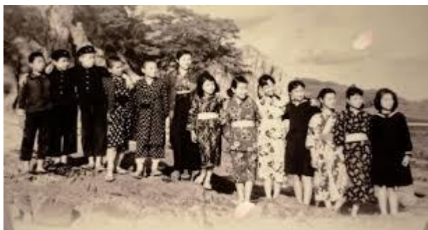
Oishi Sensei dan murid-muridnya.