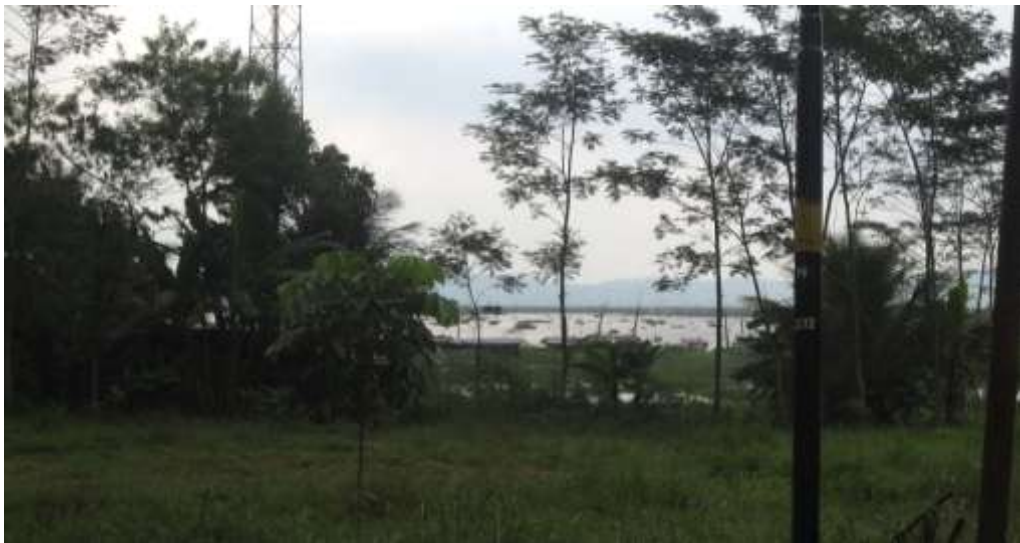
Foto view dan lokasi tapak