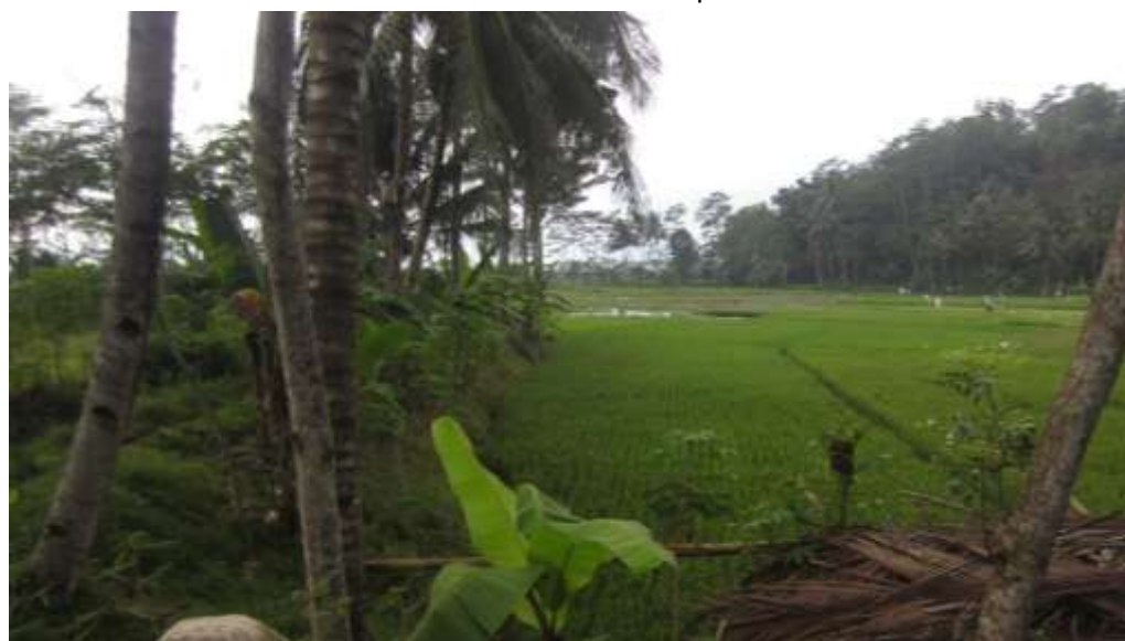
Foto lingkungan sekitar tapak