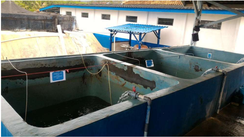
Gambar 4. Tata Letak Bak Uji Coba