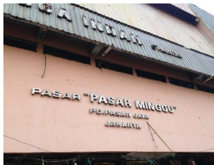
Gambar 6.2 Pasar Minggu, Jakarta Selatan

Pasar Inpres Pasar Minggu merupakan pasar tradisional yang dikelola oleh PD Pasar Jaya. Pasar ini terletak di pertigaan Jl. Raya Pasar Minggu dan Jl. Raya Ragunan yang setiap hari keadaan lalu lintas nya selalu macet terlebih pada saat jam pulang kerja. Pasar ini terdiri dari 5 blok yaitu blok B sampai F. Sebenarnya ada 6 blok (Blok A termasuk) akan tetapi sekarang Blok A sudah menjadi hak milik Terminal Pasar Minggu jadi pada bahasan ini blok A tidak ikut direvitalisasi. Total luas bangunan semua blok ini mencapai \pm 4 ha dengan total luas parkir mencapai \pm 1.1 ha.