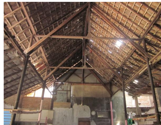
Gambar 5: Gandok untuk pabrik pembuatan batik cap; bentuk atap kampung/pelana dengan konstruksi kuda-kuda kayu yang bertumpu pada dinding dan kolom bata (foto kiri dan kanan atas), serta kombinasi struktur besi dan kayu (foto kanan bawah).