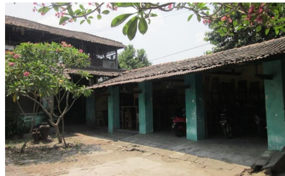
Gambar 3: Posisi gandhok di samping kiri dan belakang rumah induk (foto kanan atas); posisi gandhok di samping kanan dalam (foto kiri); dan posisi gandok di samping kiri dan di depan rumah utama-yang berfungsi sebagai tempat sepeda motor (foto kanan bawah).