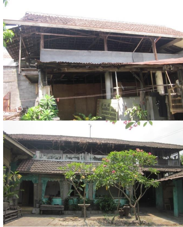
Gambar 4: Struktur bertingkat/loteng untuk efisiensi lahan dan ngisis kain batik (mengeringkan dengan hembusan angin). Peluang berkreasi dengan kombinasi bahan batu, bata dan kayu.

Gandok untuk pabrik pembuatan batik cap dengan kapasitas besar membutuhkan ruang rang cukup luas dan tinggi. Juga dibutuhkan sistim pencahayaan dan penghawaan yang baik. Bentuk atap dibuat sesederhana mungkin, yaitu kampung atau pelana, bahkan bisa semacam panggang-pe. Konstruksi atap menggunakan kuda-kuda kayu yang bertumpu pada dinding dan kolom bata. Ada juga contoh bangunan pabrik yang menggunakan kombinasi struktur besi dan kayu.