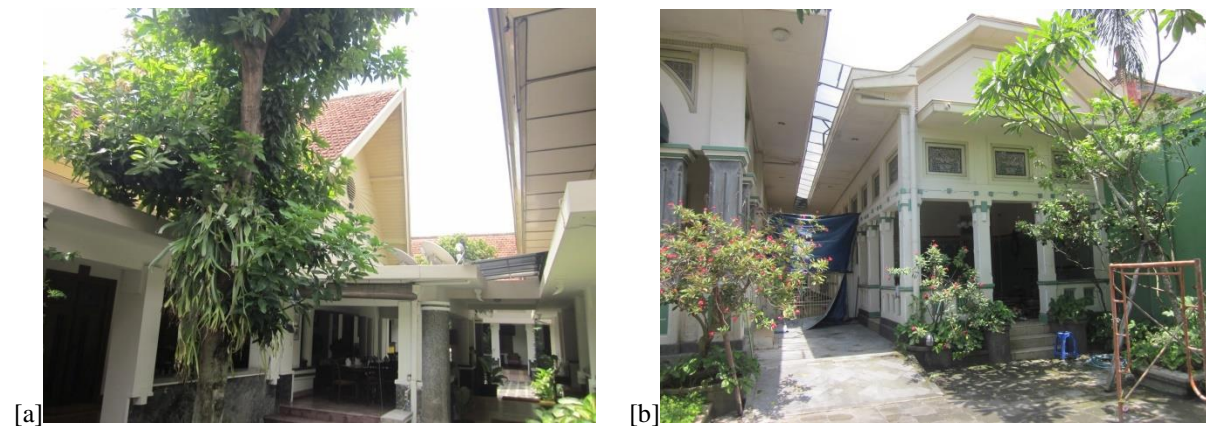
Gambar 2: [a] gandok yang berfungsi sebagai tempat tidur/paviliun dan ruang makan; [b] gandhok yang berfungsi sebagai tempat penyimpanan gamelan.

Sesuai dengan jamannya kebutuhan ruang atau wadah untuk keluarga pengusaha batik di Laweyan adalah penambahan tempat tidur, tempat untuk memproduksi batik, dan tempat untuk penyimpanan barang. Kegiatan dan wadah tersebut masih kurang terpenuhi atau tidak tepat untuk dilakukan dan diletakkan di dalam atau di pendhopo. Gandhok yang berfungsi sebagai tempat tidur atau paviliun, ruang makan, tempat penyimpanan barang berharga seperti gamelan, atau kantor, biasanya dibuat dengan bentuk lebih sederhana dengan bahan bangunan yang berkualitas baik. Namun juga menyesuaikan dengan gaya pendhopo dan dalam. Sedangkan gandhok yang berfungsi untuk pabrik dan tempat kendaraan dibuat dengan pemilihan bahan dan material yang bersifat praktis dan cenderung ‘seadanya.’