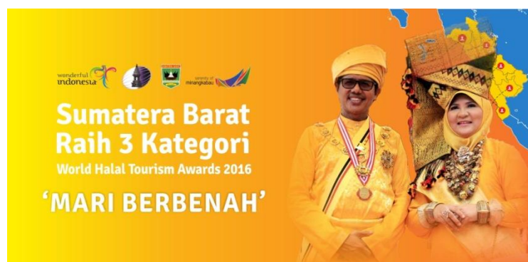
Gambar 1.1 Sumatera Barat Pemenang World Halal Tourism Award 2016

Pada ajang World Halal Tourism Award 2016 di Abu Dhabi Uni Emirat Arab, Sumatera Barat mengukuhkan diri sebagai destinasi wisata halal terbaik dunia 2016 sebagai pemenang di kategori World's Best Halal Culinary Destination dan World's Best Halal Destination . ERO Tour , yang juga menjadi perwakilan Sumatera Barat, juga merupakan salah satu pemenang di ajang ini sebagai World's Best Halal Tour Operator .