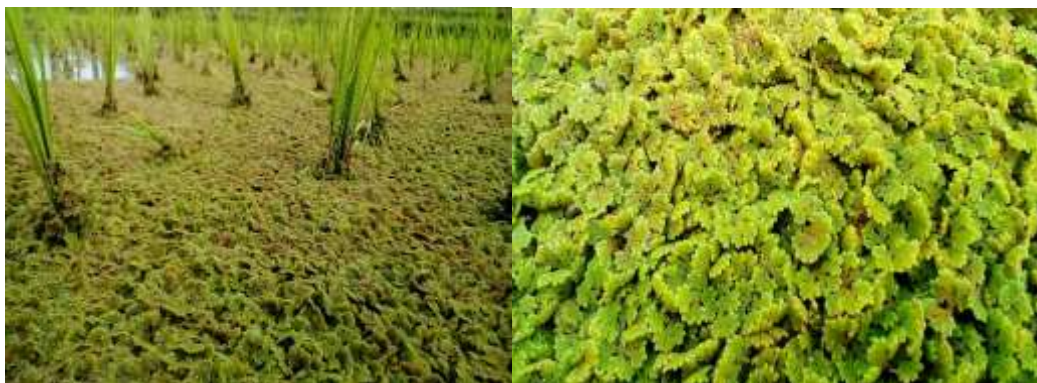
Ilustrasi 2. Tanaman Azolla pinnata

Hasil dekomposisi limbah pertanian, peternakan, perikanan dan rumah tangga disebut sebagai pupuk organik. Beberapa sumber pupuk organik yang dapat digunakan yaitu tanaman Azolla pinnata , pupuk kandang sapi, kambing dan ayam. Azolla mengandung 4 – 5 % N berdasarkan bahan kering, 0,2 – 0,4% N dari berat segar, bahan kering, bahan organik, kalsium, fosfor masing-masing 4,12; 75,73; 2,58; 0,26% (Halder dan Kheroar, 2013; Chreryl dkk., 2014). Produksi azolla rata-rata sekitar 1,5 kg/m 2 /minggu (Mishra dkk., 2013). Azolla tumbuh di daerah dengan kondisi air yang tenang, misalnya bendungan, kolam, saluran irigasi, danau, atau parit (Ilustrasi 2). Pemupukan Azolla pinnata 3 ton/ha mampu meningkatkan kandungan N total tanah 32,7% (Setiawati, 2014).