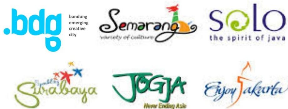
Gambar 1 : Memperlihatkan berbagai jenis identitas visual, destination branding yang di dalamnya mengandung elemen tagline yang sekaligus menjadi simbol visual.

Dari pendahuluan diatas muncul sebuah pertanyaan: Apakah jenis tindakan tutur yang digunakan? Bagaimana peristiwa tutur disampaikan? dan Apa jenis tagline yang digunakan? Penelitian ini menggunakan metode deskriptif dengan pendekatan kualitatif, dengan metode analisis menggunakan metode komparatif sehingga didapat jawaban dari pertanyaan penelitian ini.