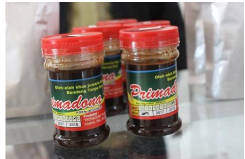
Gambar 4. Petis Bandeng dari UKM Primadona