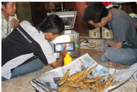
Gambar 2. Penyuluhan alat menggunakan Vacuum Sealer untuk UKM Kembar Sumber Rejeki

Gambar 2 merupakan proses penyuluhan yang kami lakukan untuk UKM Kembar sumber