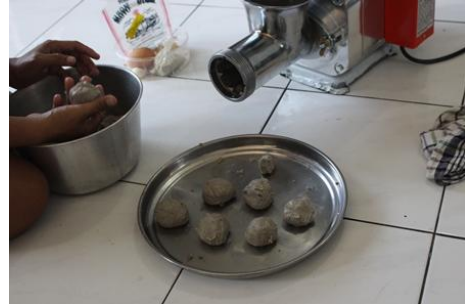
Gambar 3. Penyuluhan pembuatan bakso bandeng untuk UKM Primadona