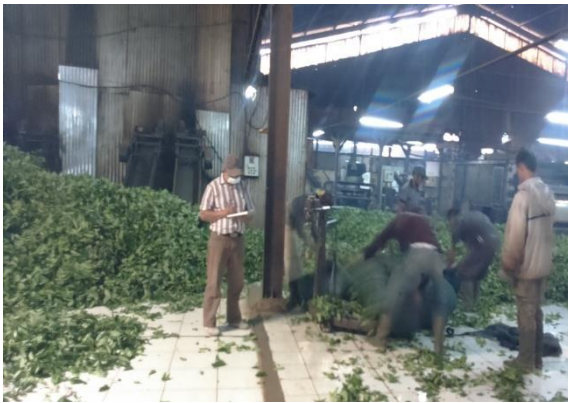
Penimbangan daun teh di pabrik