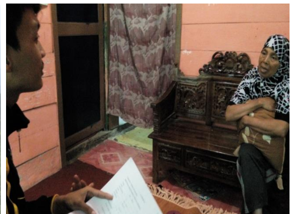
Wawancara kepada salah satu