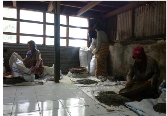
Pekerja bagian sortasi teh