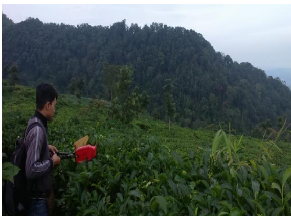
Kegiatan pemetikan teh di