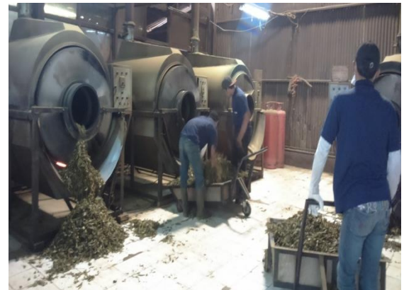
Proses pengolahan daun teh