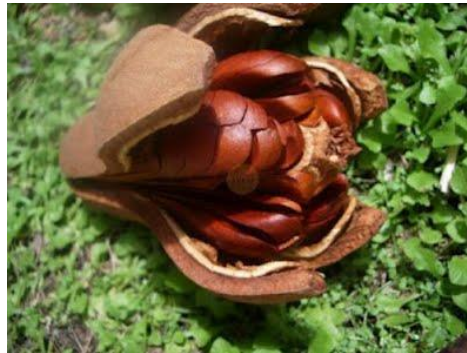
Gambar 2. Buah Mahoni