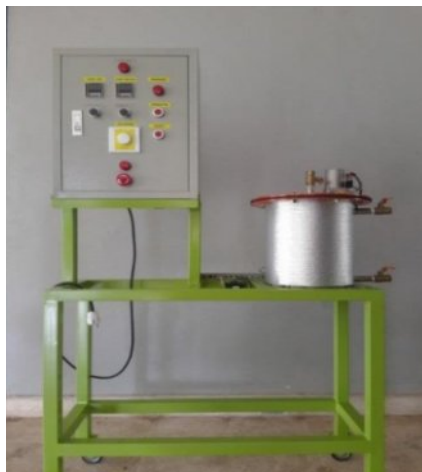
Gambar 3. Kalorimeter Bom