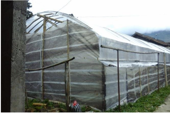
10.1. Greenhouse tampak depan