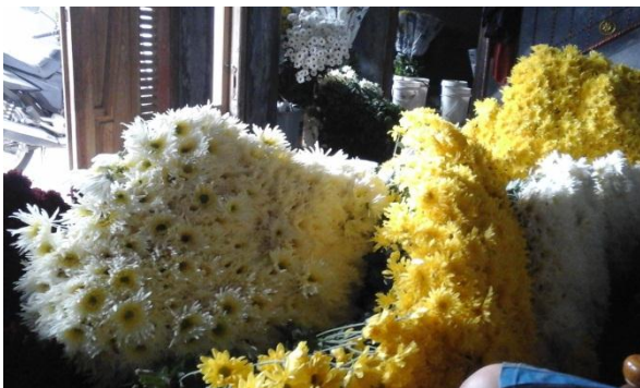
10.5. Packing bunga