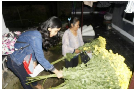
10.4. Membantu panen