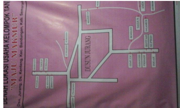
10.2. Denah Lokasi Kelompok Tani