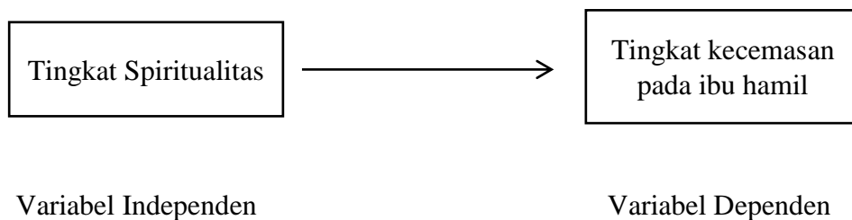
Gambar 3.1 Kerangka Konsep

Kerangka konsep merupakan sebuah bagan yang menggambarkan hubungan antar variabel yang akan diamati atau diukur melalui sebuah penelitian yang akan dilakukan. 49 Kerangka konsep dalam penelitian ini akan menggunakan 2 variabel yaitu variabel independen dan variabel dependen. Variabel independen dalam penelitian ini adalah tingkat spiritualitas, sementara variabel dependen dalam penelitian ini adalah kecemasan pada ibu hamil.