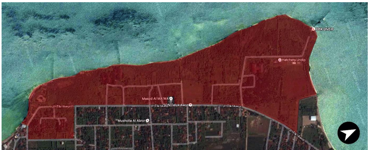
Gambar 6.1 Lahan Marine Station Undip seluas 51 hektar (Area Merah)