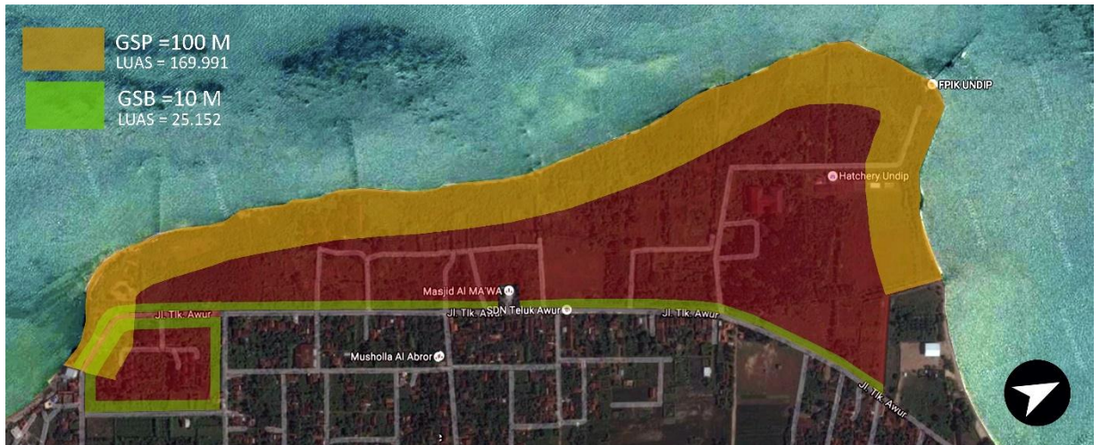
Gambar 6.2 Perhitungan GSB dan GSP Marine Station Undip