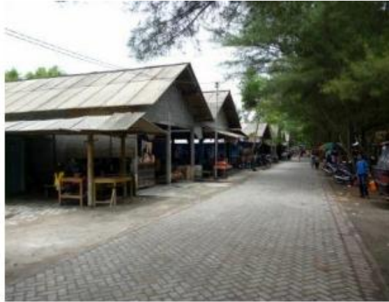
Gambar 3. Usaha Kuliner di Pantai Kuwaru