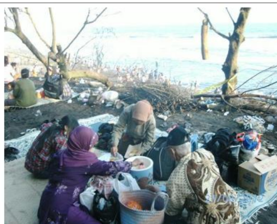
Gambar 2. Aktivitas Wisatawan di Pantai Kuwaru

Pantai Kuwaru memiliki beberapa komoditas yang potensial dikembangkan menjadi komoditas pariwisata. Selain hasil laut dan vegetasi cemara laut, Pantai Kuwaru memiliki potensi akan keindahan alam pantai yang eksotis. Adapula wisata kuliner seafood dari hasil tangkapan para nelayan di Dusun Kuwaru. Aktivitas wisatawan di Pantai Kuwaru terlihat di gambar 2 berikut: