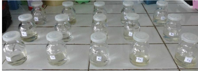
Gambar 1. Wadah pemeliharaan Oithona sp. selama penelitian dan tata letak wadah secara acak

pada botol pengamatan, dan monitoring kualitas air. Perhitungan kepadatan Oithona sp. meliputi naupli, copepodit, dewasa dan dewasa bertelur dilakukan setelah 4 hari pemeliharaan.