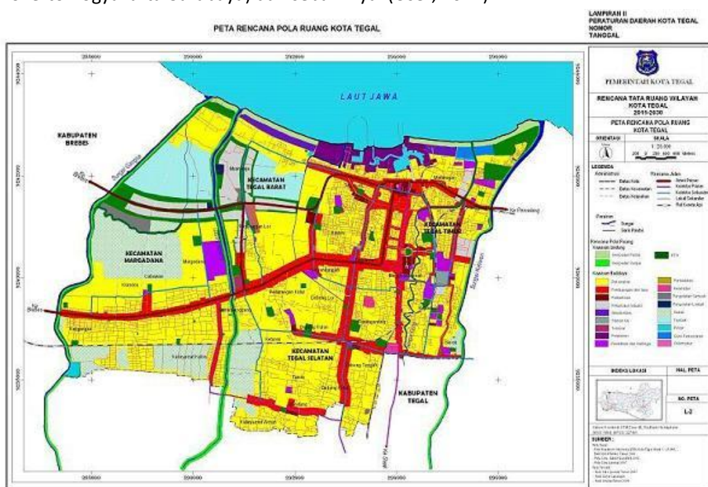
Gambar 3.1 Peta Kota Tegal

Kota Tegal Terletak diantara 109°08' - 109°10' Bujur Timur dan 6°50' - 6°53' Lintang selatan, dengan wilayah seluas 39,68 Km 2 atau kurang lebih 3.968 Hektar. Kota Tegal berada di Wilayah pantai utara, dari peta orientasi Provinsi Jawa Tengah berada di Wilayah Barat, dengan bentang terjauh utara ke Selatan 6,7 Km dan Barat ke Timur 9,7 Km. Dilihat dari Letak Geografis, Posisi Kota Tegal sangat strategis sebagai Penghubung jalur perekonomian lintas nasional dan regional di wilayah Pantai Utara Jawa ( Pantura ) yaitu dari barat ke timur (Jakarta-Tegal-Semarang-Surabaya) dengan wilayah tengah dan selatan Pulau jawa (Jakarta-Tegal-Purwokerto-Yogyakarta-Surabaya) dan sebaliknya. (User, 2014)