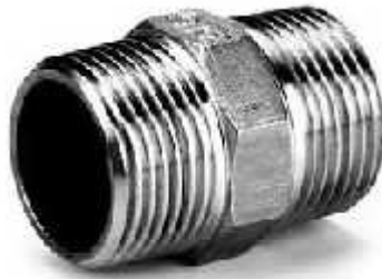
Gambar 3.8 Double Nipple

Double Nipple adalah sambungan pipa dengan karakteristik mempunyai drat luar pada sisi-sisinya. Fungsi double nipple sebagai sambungan perpanjangan antar pipa. Double nipple yang digunakan berdiameter 1” untuk tiap sisi dengan bahan galvanis.