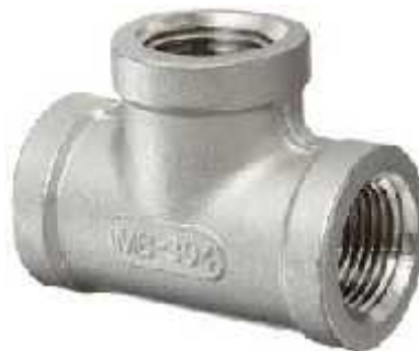
Gambar 3.7 Tee

Tee adalah sambungan pipa berbentuk huruf T dengan fungsi sebagai sambungan pipa percabangan. Tee yang digunakan dalam rancang bangun pompa ini menggunakan jenis pipa fitting reducing tee dengan diameter 1/4" dan 1" yang terbuat dari material galvanis.