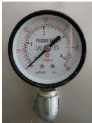
Gambar 3.13 Manometer Tekan

Manometer tekan digunakan untuk mengukur tekanan air yang keluar dari pompa dan tekanan udara dari dalam tangki kedap udara.