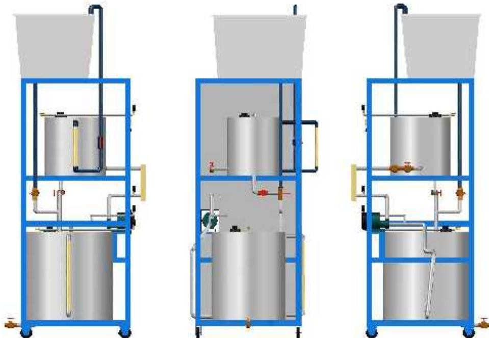
Gambar 3.16 Sistem Instalasi Pompa

Pembuatan rancangan alat uji head statis pompa dibuat menggunakan software solidwork yang menghasilkan sebuah rancangan instalasi pompa sebagai berikut :