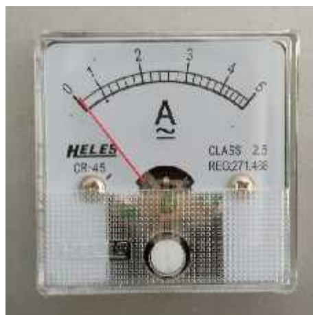
Gambar 3.14 Amperemeter