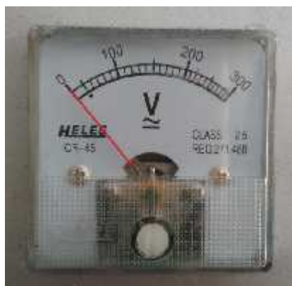
Gambar 3.15 Voltmeter

Voltmeter digunakan untuk mengukur tegangan pada motor penggerak pompa.