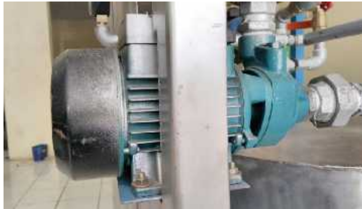
Gambar 3.2 Pompa Sentrifugal

Pompa yang digunakan adalah pompa sentrifugal dan fluida yang digunakan adalah air. Berikut spesifikasi pompa sentrifugal yang digunakan :