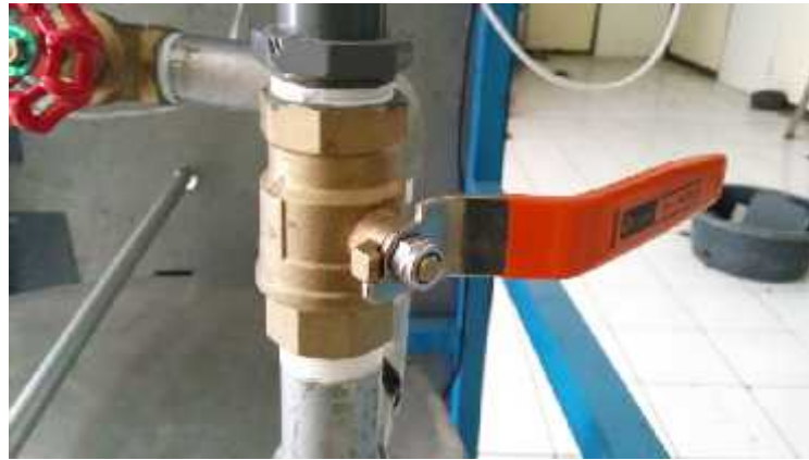
Gambar 3.6 Stop Kran

Stop kran yang digunakan dalam rancang bangun ini ada dua jenis yaitu berbahan kuningan dan pvc dengan diameter lubang 1". Fungsinya untuk membuka dan menutup aliran.