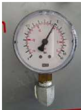
Gambar 3.12 Manometer Vakum

Manometer vakum digunakan untuk mengukur tekanan isap air yang masuk ke pompa.