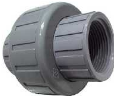
Gambar 3.9 Water Mur PVC 1”

Water mur adalah sambungan pipa yang berfungsi sebagai penyambung pipa yang dapat dilepas pada waktu pembongkaran instalasi. Water mur yang digunakan dalam rancang bangun pompa ini berdiameter 1”. Water mur yang digunakan untuk sambungan flow meter berbahan pvc, sedangkan water mur yang digunakan untuk sambungan pompa dan tangki bertekanan terbuat dari galvanis.