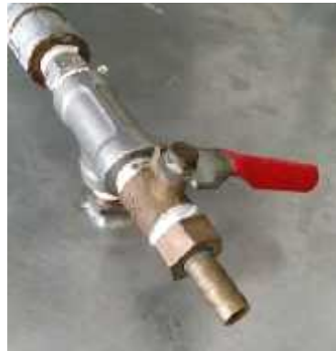
Gambar 3.10 Air Vent

Air Vent adalah sambungan pipa yang berfungsi sebagai keluar masuk udara pada tangki. Air vent yang digunakan berdiameter 1/4" terbuat dari kuningan.