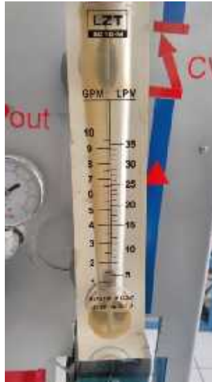
Gambar 3.11 Flow meter