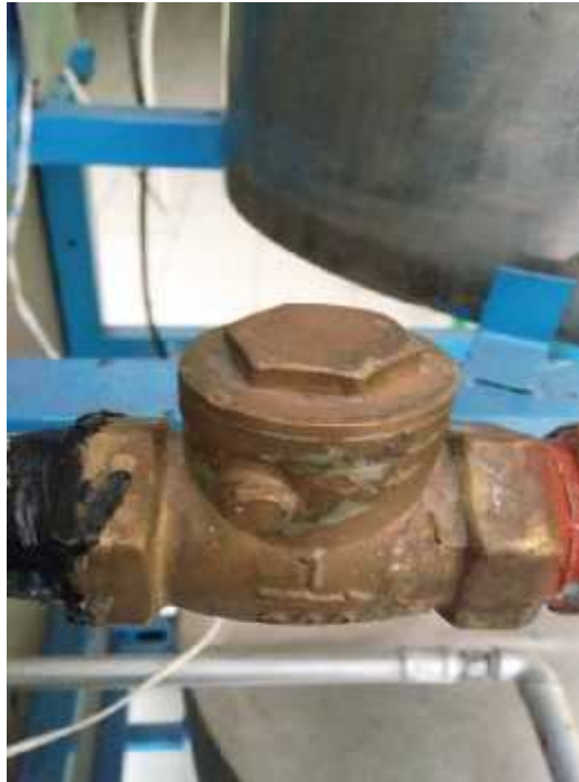
Gambar 3.4 Check Valve