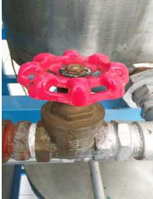
Gambar 3.3 Gate Valve