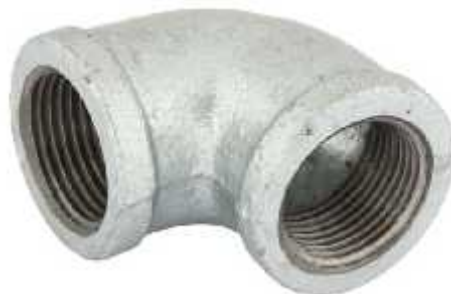
Gambar 3.5 Elbow Galvanis 1"

Elbow berfungsi untuk membelokkan jalur pipa atau sebagai sambungan belokan dengan tujuan mengikuti skema instalasi pompa. Elbow yang digunakan dalam rancang bangun alat uji pompa ini adalah elbow dengan sudut belok 90^\circ berdiameter 1". Elbow ini terbuat dari material galvanis.