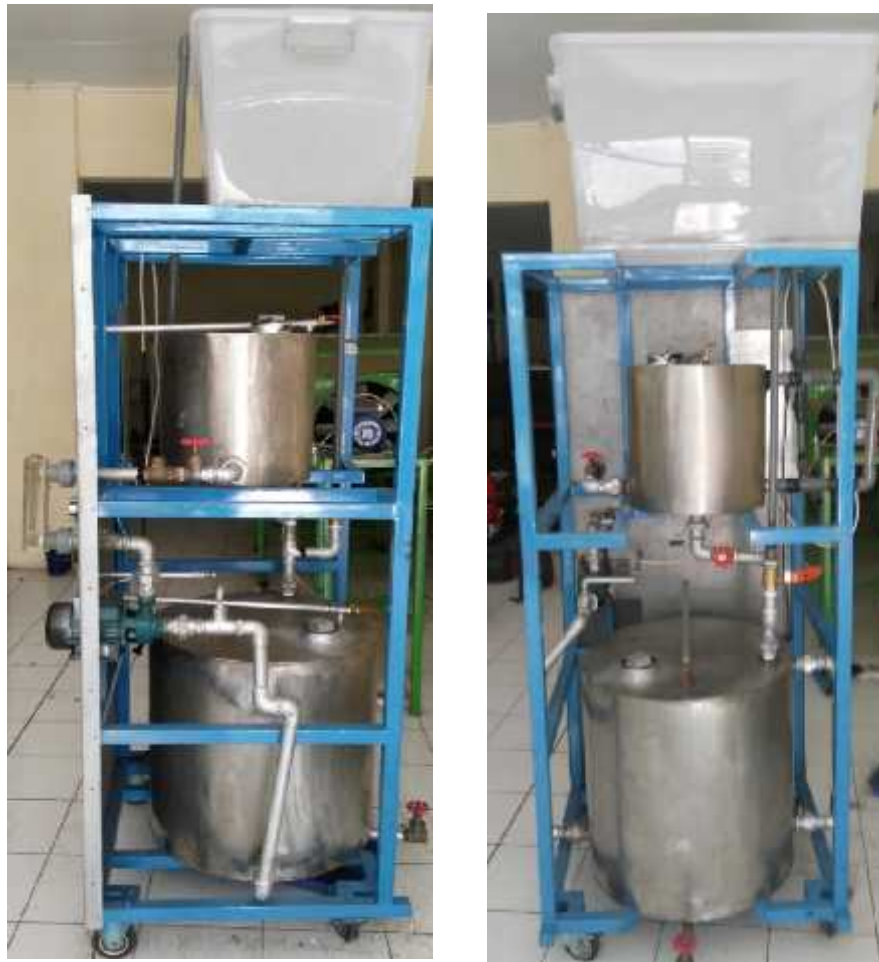
Gambar 3.17 Sistem Perpipaan

Pembuatan sistem perpipaan ini menggunakan berbagai penyesuaian dengan rangkaian pompa. Hasil dari penyesuaian tersebut menghasilkan rangkaian instalasi pompa sebagai berikut :