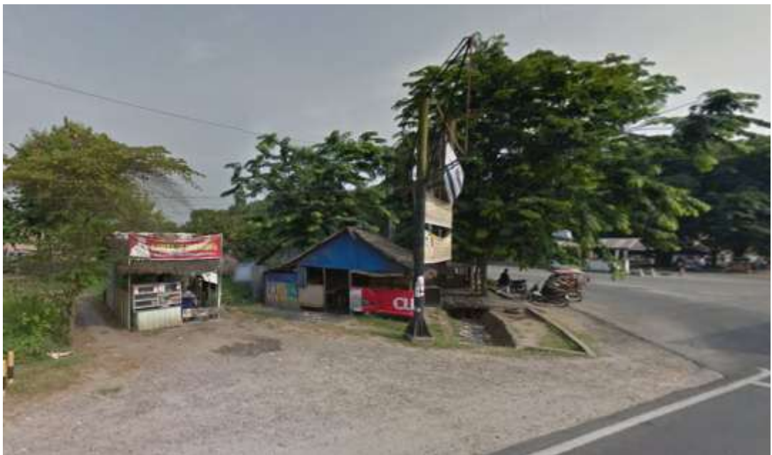
Gambar 5.6 Gubuk rumah makan milik warga dan persimpangan yang berada di utara dari lahan 2