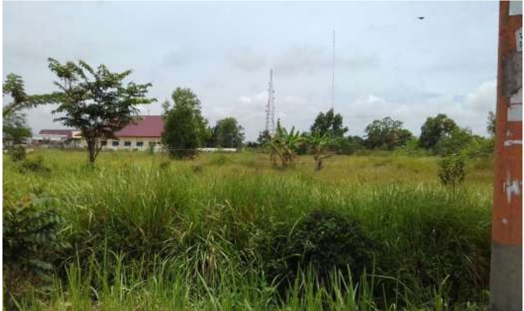
Gambar 5.3 Keadaan lahan dilihat dari Jalan Lintas Timur Sumatera