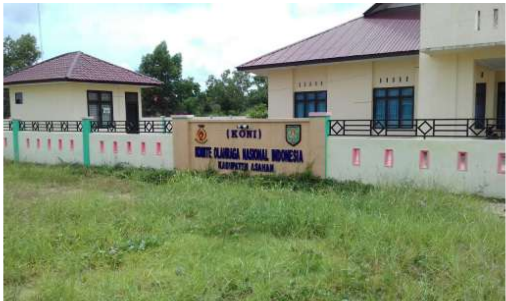
Gambar 5.4 Kantor KONI yang berada di selatan dari lahan 2