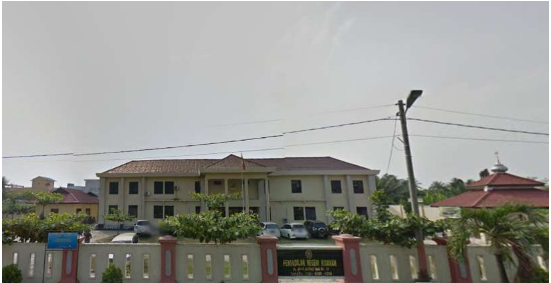
Gambar 5.5 Pengadilan Negeri Kota Kisaran yang berada di timur dari lahan 2