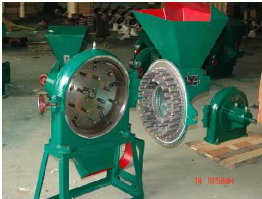
Gambar 2.3 Disk Mill

merica, jagung, tongkol jagung, bumbu-bumbu kering dan masih banyak lagi bahan lainnya. Supaya bisa menghasilkan tepung berkualitas bagus, maka sebaiknya semua bahan yang akan dibuat tepung harus melewati tahapan pengeringan terlebih dahulu.