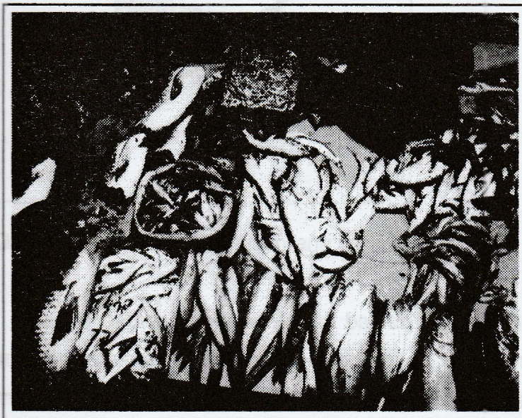
Gambar 1. Ikan basah