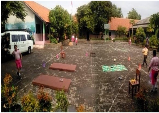
Lokasi circuit training