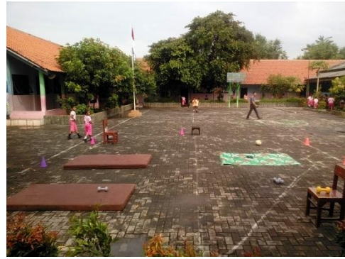
Lokasi circuit training