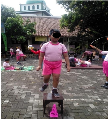
Going up and down