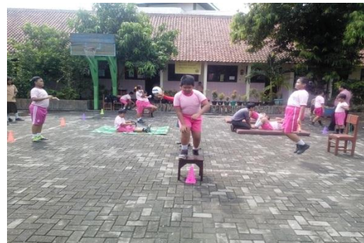
Pelaksanaan circuit training