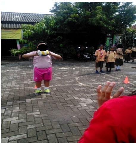
Lempar tangkap bola