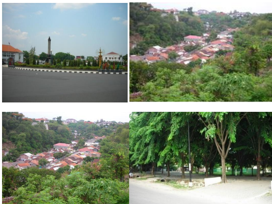
Gambar 4. Ruang Terbuka Hijau di Kota Semarang