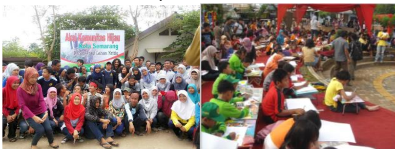
Gambar 7. Kegiatan Forum Komunitas Hijau Kota Semarang

Dampak positif dari P2KH kemudian dirasakan positif bagi Pemerintah Kota Semarang, terutama dalam hal perubahan kebijakan dasar pembangunan kota yang perlahan-lahan menjadikan ruang terbuka hijau sebagai prioritas. Beberapa taman yang dibangun diluar P2KH juga dilakukan, yang dulunya bahkan tidak pernah terbayangkan di lokasi tersebut akan dijadikan sebuah taman.