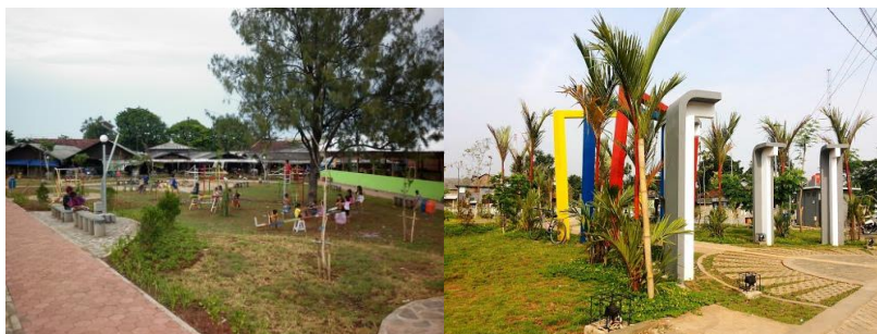
Gambar 6. Taman P2KH Kota Semarang

Pada tahap pertama P2KH tersebut, masih fokus pada pengembangan 3 atribut, yaitu green spatial planning and design, green open space, green community. Yang berbeda dengan kegiatan pengembangan ruang terbuka hijau biasanya adalah pada penekanan adanya green community/ komunitas hijau. Komunitas hijau ini adalah salah satu upaya meringankan beban pemerintah dalam pengembangan ruang terbuka hijau. Pada tahap awal di Kota Semarang terbentuk sebuah forum komunitas hijau yang merupakan kumpulan dari komunitas-komunitas masyarakat yang peduli pada pelestarian lingkungan hidup. Awalnya forum komunitas hijau terdiri dari 18 komunitas, yang sekarang sudah berkembang menjadi lebih dari 25 komunitas, dan tidak hanya berisi komunitas peduli lingkungan, namun ada juga komunitas blogger, komunitas skateboard , komunitas reptil, dan lain sebagainya. Harapannya ke depan, forum komunitas hijau inilah yang berperan aktif bersama-sama dengan pemerintah dalam mewujudkan visi kota hijau.