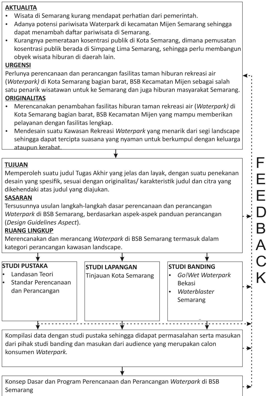
Gambar 1.1 Diagram Alur Pikir