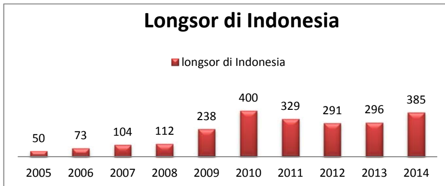
Tabel 1.1 Longsor Di Indonesia

Dalam kejadian longsor tidak hanya korban jiwa tetapi juga mengakibatkan banyak kerugian materiil, sebanyak 79.339 orang mengungsi, 7679 unit rumah rusak berat, 1.186 rumah rusak sedang dan 8.140 rumah rusak ringan. BNPB juga telah memetakan daerah rawan longsor yang meliputi Bukit Barisan Sumatra, Jawa Bagian tengah dan Selatan, Bali, Nusa Tenggara, Sulawesi, Maluku dan Papua karena daerah ini adalah dataran tinggi dan perbukitan dan pegunungan 2