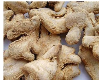
Gambar 1. Jahe