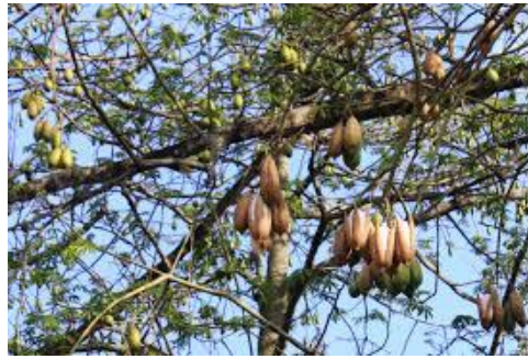
Gambar 1. Pohon Biji kapuk

Pentandra var. guineensis ) berasal dari sebelah barat Afrika. Kata "kapuk" atau "kapok" juga digunakan untuk menyebut serat yang dihasilkan dari bijinya. Pohon ini juga dikenal sebagai kapas Jawa atau kapok Jawa, atau pohon kapas sutra. Juga disebut sebagai ceiba. Pohon ini tumbuh hingga setinggi 60-70 m dan dapat memiliki batang pohon yang cukup besar hingga mencapai diameter 3 m. Pohon ini banyak ditanam di Asia, terutama di pulau Jawa, Indonesia, Malaysia, Filipina dan Amerika Selatan ( Juanda & Cahyono, 2003).