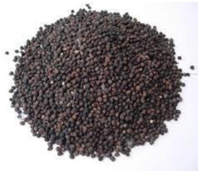
Gambar 2. Biji kapuk