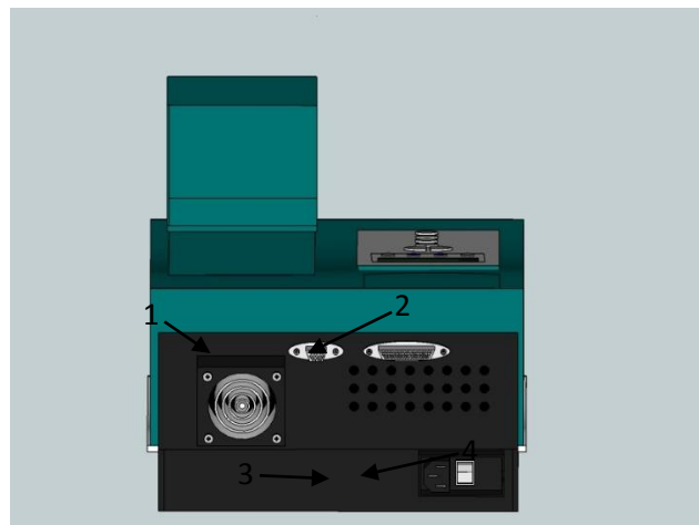
Gambar 6. Tampak Belakang Rancangan Alat Spektrofotometer