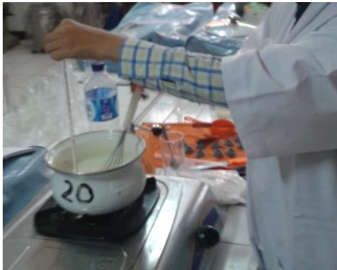
Gambar 3. Alat inkubasi yoghurt