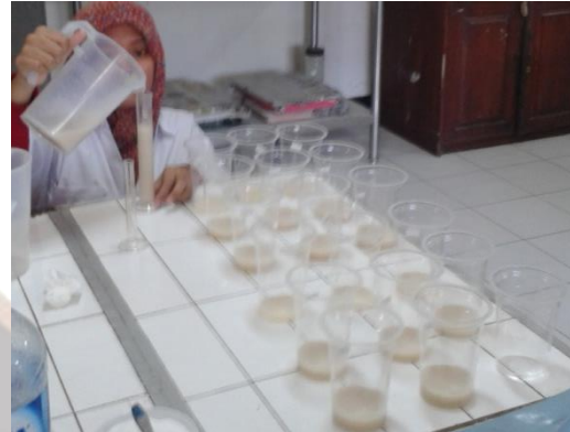
Gambar 4. Yoghurt pada proses inkubasi