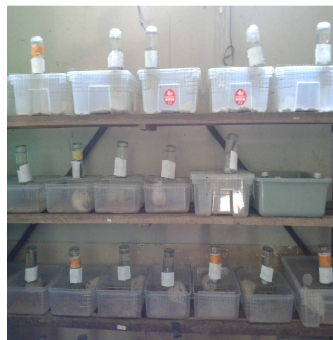
Pengandangan Individu Tikus