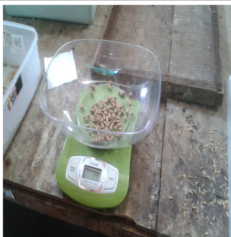
Penimbangan Pakan Tikus