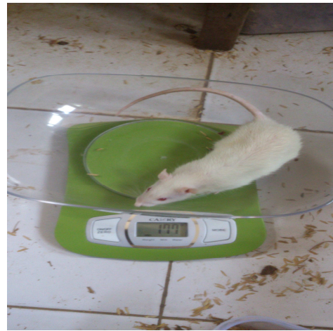
Penimbangan Berat Badan Tikus