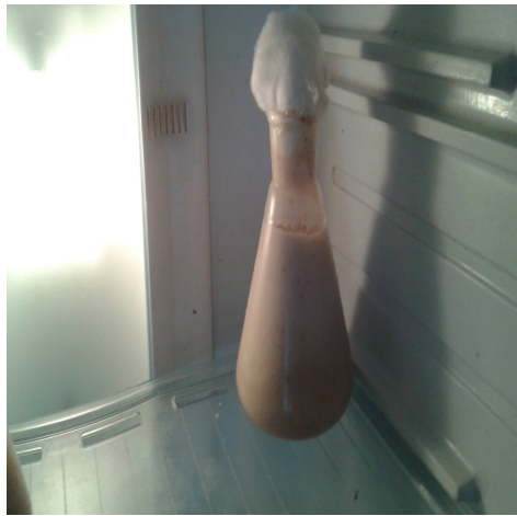
Yoghurt Tanpa Lemak ditambah Tepung Gembili