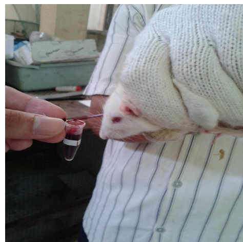
Pengambilan Darah Tikus