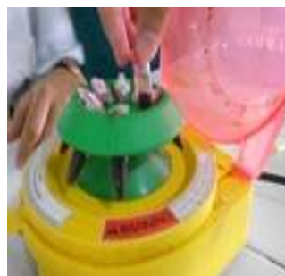
Gambar 9. Proses sentrifuge darah tikus menjadi serum