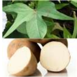
Gambar 3. Daun ubi jalar hijau dari umbi putih