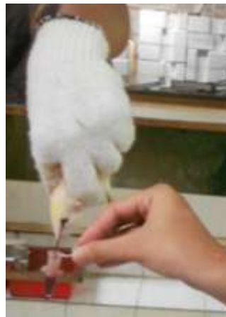
Gambar 8. Proses pengambilan darah tikus melalui pleksus retroorbitalis .