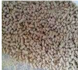
Gambar 4. Pakan standar (BR-2 comfeed)