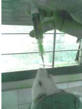
Gambar 7. Proses pemberian jus daun ubi jalar melalui sonde lambung