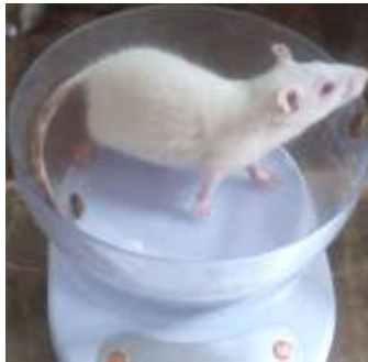
Gambar 5. Proses penimbangan berat badan tikus